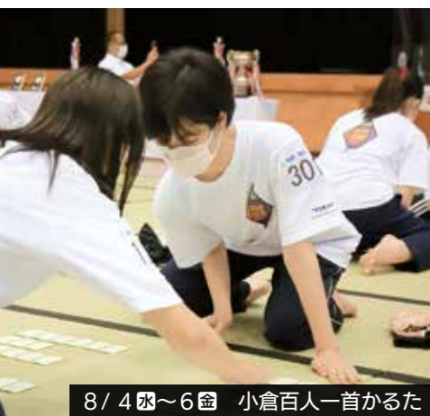
8/4 小倉百人一首かるた