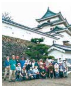
いきいきシニアわかやま【地域福祉文化活動】

プラスチックの利便性と恩恵を最大限に生かしながら、海洋プラスチック等の環境汚染問題に対して大きな効果のある業績が世界で評価され、文部科学大臣表彰若手科学者賞、ゴットフリード・ワグネル賞等を受賞している。