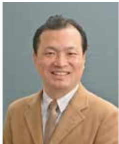
かねこ たつお 金子 達雄【化学者】

未踏の研究に注力し国際的評価を得て、経済学の入りを国民に知らしめ、数理分析を用いて本質を解く姿勢は経済学のみにとどまるものではなく、政治・スポーツ・国際情勢・文化の発展において多大な功績を残している。