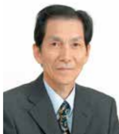
みやもと かつひろ 宮本 勝浩【経済学者】

大阪府立大学経済学部長、副学長を歴任後、関西大学大学院会計研究科教授に就任。神戸大学より経済学博士号を授与。移行経済における数理分析について、世界でも非常に高い評価を受ける。