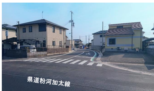
① 県道粉河加太線から南向き