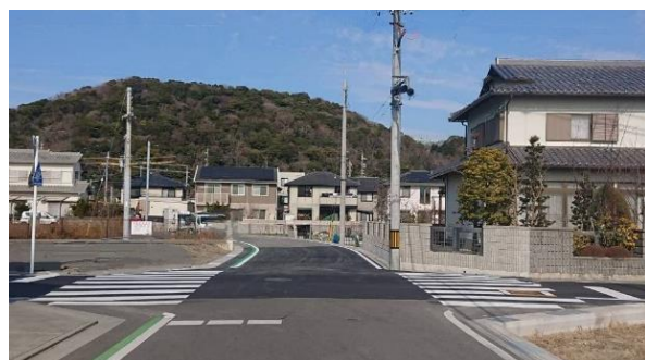
② 既設市道西脇19号線から北向き