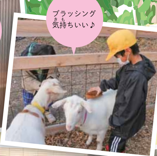
ブラッシングも気持ちいい♪