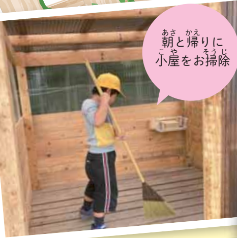
あさかえ朝と帰りに小屋をお掃除