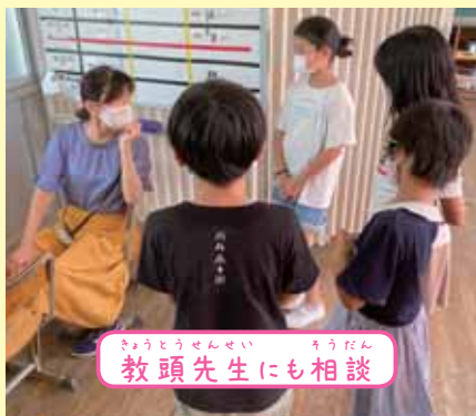
教頭先生にも相談