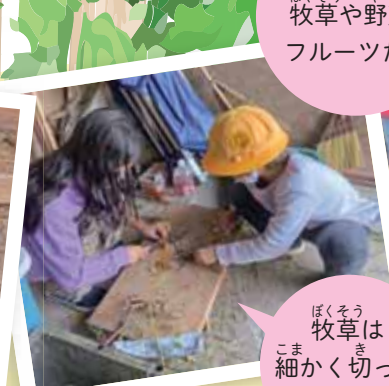
ぼくそう 牧草は細かく切ってあげるよ