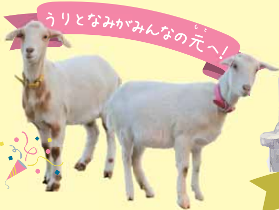
うりとなみがみんなの元へ!