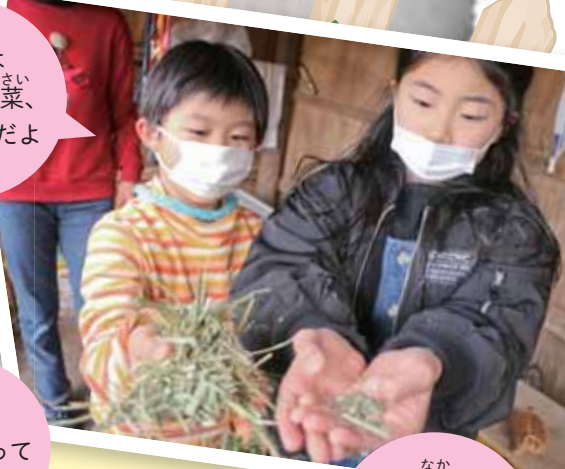
なか お腹をこわさないように野菜は乾燥させるんだ