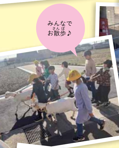
みんなでさんぽお散歩♪