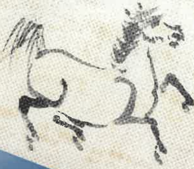
徳川吉宗筆 野馬図