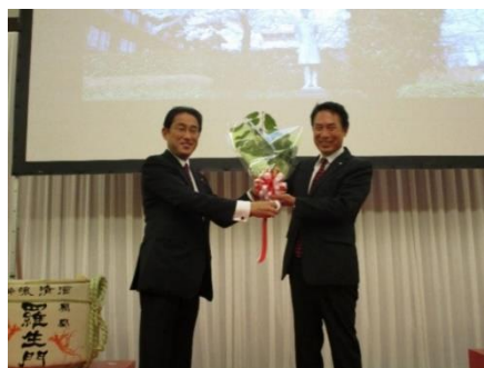
【平成28年11月外務大臣及び和歌山県知事共催レセプション（外務省公館）にて】