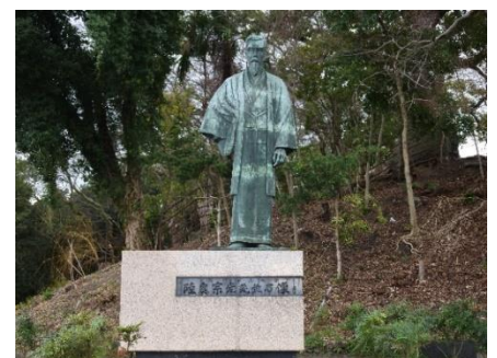
【岡公園の陸奥宗光伯の銅像】