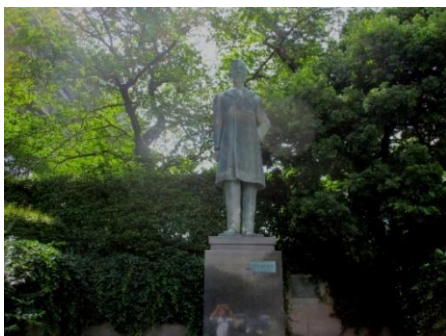
【外務省の陸奥宗光伯の銅像】