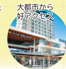
大都市から好アクセス