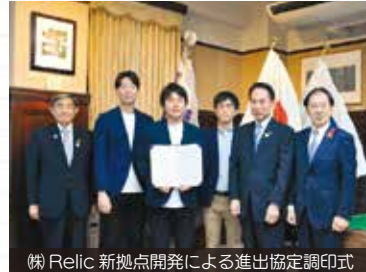
東京に本社を置く企業が 和歌山市に次々と進出