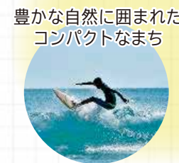
豊かな自然に囲まれたコンパクトなまち