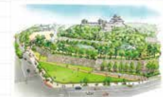
▲扇の芝整備イメージ