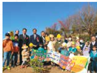
◀ 「レモンの丘」（雑賀崎）には、イタリア総領事が訪れました。