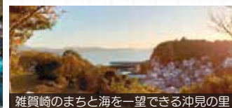
雑賀崎のまちと海を一望できる沖見の里