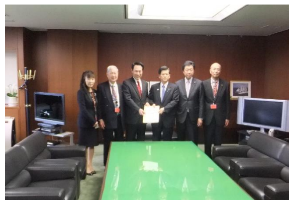
期成同盟会による石井国土交通大臣（当時）への要望