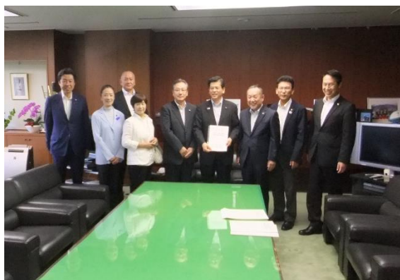
市議会議員連盟による石井国土交通大臣（当時）への要望