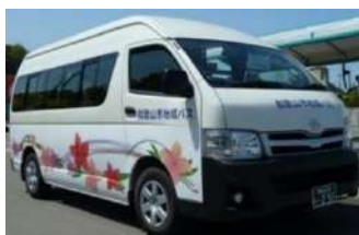
（参考：地域バス紀三井寺団地線）

内 容：利用人数や収支率、運行経費のほか道路渋滞や走行環境などの安全性等について調査し、地域バス運行の可能性を検討します。