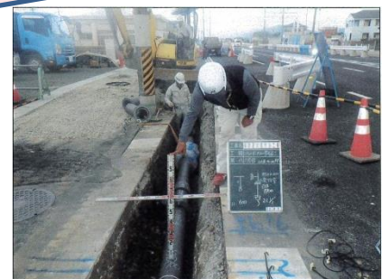
相互連絡管の布設