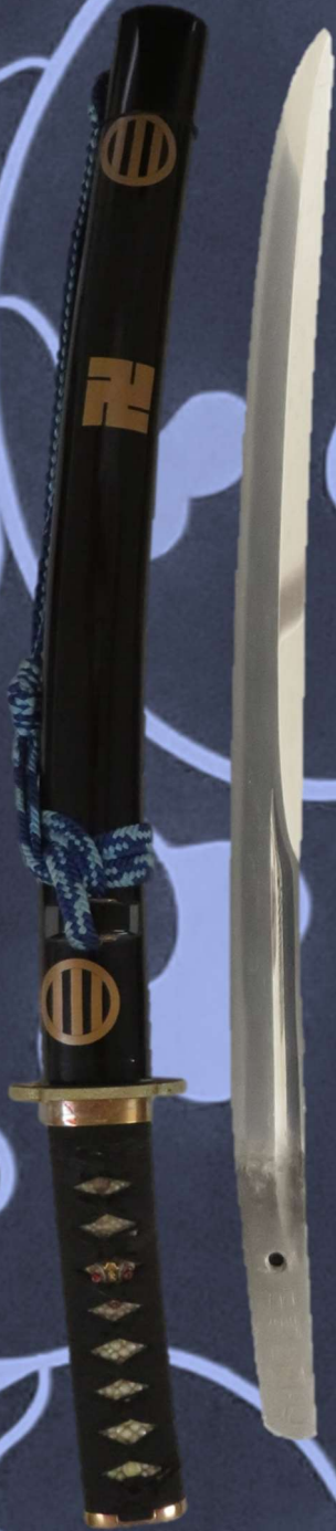
脇差 銘 但州住國光 (個人蔵)