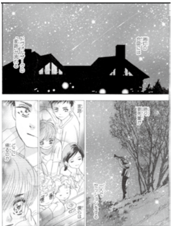
『SEEDS』では、和歌山城から聞こえてきたヴォルサークの『家路』を取り入れている。

漫画には自分の人生すべて、思考や体験すべてが注入されると思っています。楽しいこと辛いこと恥ずかしいこと、すべてです。和歌山での子供時代は自分の基本を作っていると思うので、意識するしないに関わらず、漫画には活かされているはず。風土として、歴史があって温暖で海がすぐそばというのもきっと大きい。具体的な場所としては『BASARA』という作品で紀州熊野を舞台にしていますし、『ボクがくになった理由（ワケ）』シリーズでは紅葉溪庭園をイメージした「つつじ谷」という庭園を出しています。城（跡）の虎の銅像なんかも出てますね。