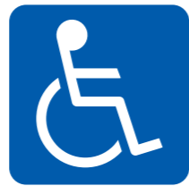
障害者のための国際シンボルマーク

すべての障害者が利用できる建物、施設であることを明確に表すための世界共通のシンボルマークです。