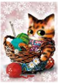
『猫 mix 幻奇譚 たらじ』 ©田村由美/小学館

小学生の頃、大雨で洪水になり床下浸水に見舞われたことがありました。休校になって、膝まで水に浸かりつつ子供の自分にはしゃいでました。今、実家の近辺の地下には大きな排水管が通り、もう洪水の心配はないのだから。そうやって安心して両親を見ると、市の政策をありがたく思います。だけど年々周辺は寂しくなって、シャッター街と化しているところも多いです。自分も出ていった人間なのでどうこうは言えませんが。賑やかな場所は移り変わったと聞いています。海外に開かれたおらかな気風、豊かな海と山が残っていつてくれたらなと思います。新型コロナ対策での決断力、実行力は東京にも鳴り響いていました。マクロとミクロの視点を持って軽やかに動ける市でいてください。