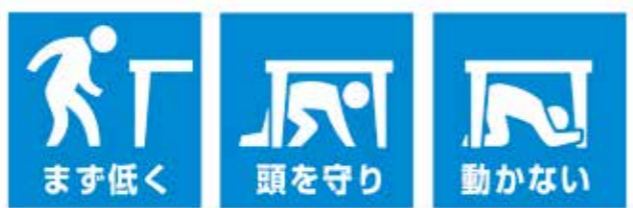
【イラスト提供】効果的な防災訓練と防災啓発提唱会議

今回の訓練では、ぜひ、家庭や職場で「地震の際の安全行動」(上イラスト)を1分間とり続けてください。