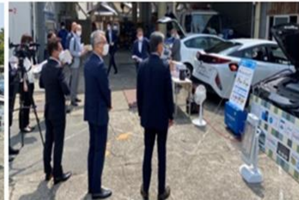
次世代環境者を見入る真砂市長(右)