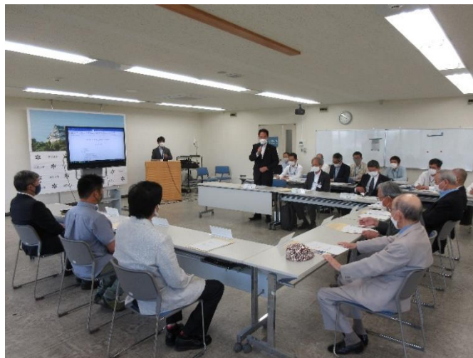
第1回市堀川かわまちづくり協議会 開催風景