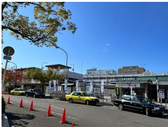
現況の和歌山駅東口

本事業では、将来的なJR和歌山駅東口周辺のまちづくりを見据え、 賑わい創出 、 利便性の向上 及び 駅前広場機能の充実 を図ることを目的としています。