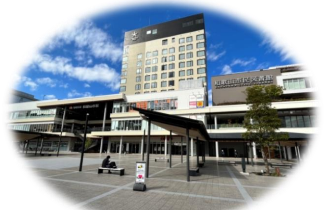
高度利用イメージ（キーノ和歌山）