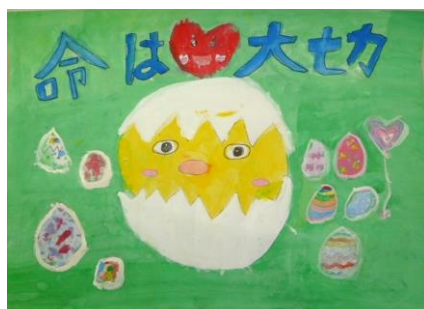
杖村 優妃 様