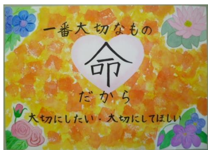
瀧本 絢心 様