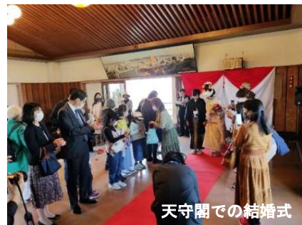
天守閣での結婚式