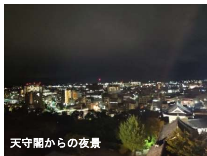
天守閣からの夜景