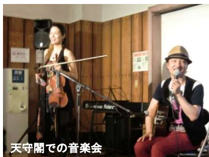
天守閣での音楽会