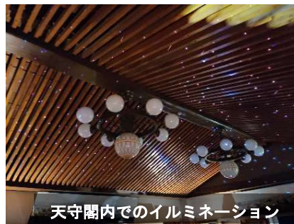
天守閣内でのイルミネーション

1 貸切利用料…次の(1) + (2)の合計（17:30～20:30 ※撤去作業含む）