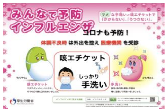
2023 インフルエンザ予防啓発ポスター