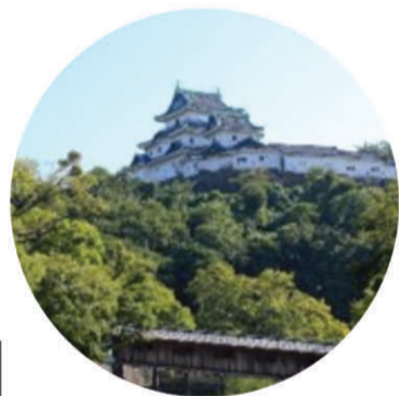
和歌山城 - Castle -

[ What you need ] 公道を走ることができる整備された自転車、ヘルメット、グローブ、マイボトル、スマートフォン(チームに1台) ※参加者全員が自転車保険に加入していること (本イベント主催側で付帯している保険はありません。)