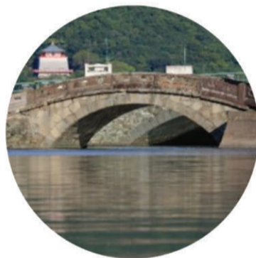
和歌の浦 - Scenery -