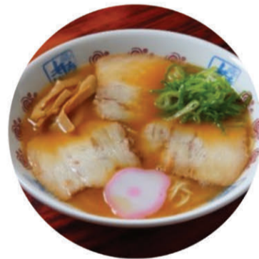
中華そば - Food -