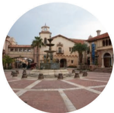
マリーナシティ - Theme park -