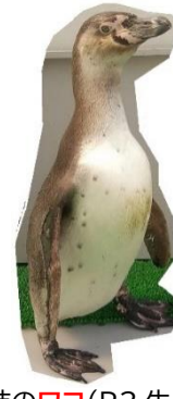
ハル(R5生まれ 性別不明)