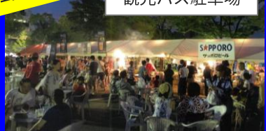
お酒含め、ドリンクを楽しむ