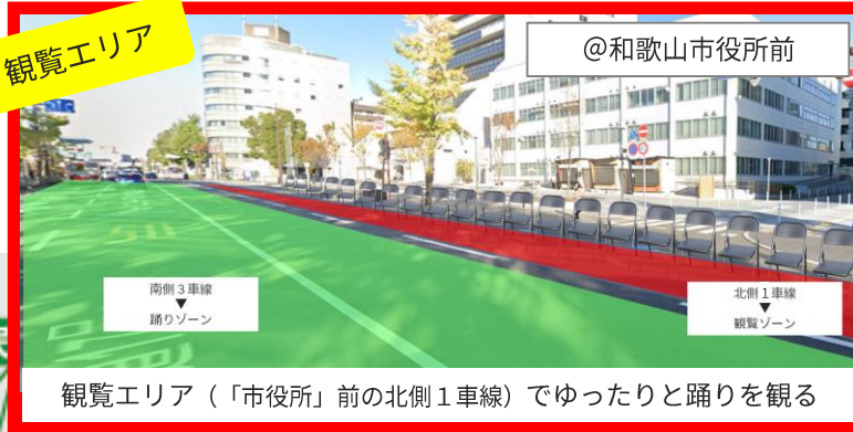
観覧エリア（「市役所」前の北側1車線）でゆったりと踊りを観る