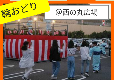
輪になり、ぶんだら節を踊る