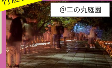
竹あかりの光に彩られた夜の和歌山城を歩く