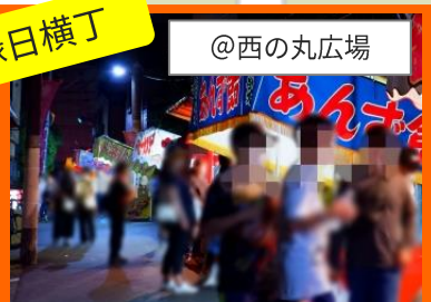
祭りの醍醐味、食を味わう