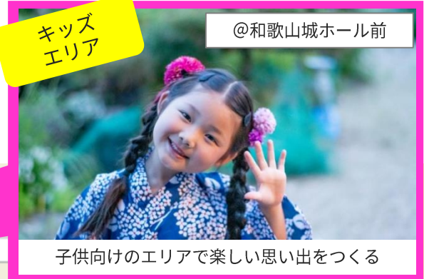
子供向けのエリアで楽しい思い出をつくる