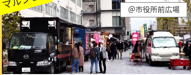
キッチンカーで食を楽しむ