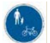
ほどうつこうか 『歩道通行可』の 道路標識