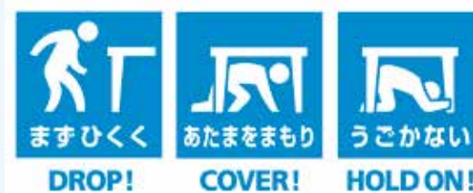
【イラスト提供】効果的な防災訓練と防災啓発提唱会議