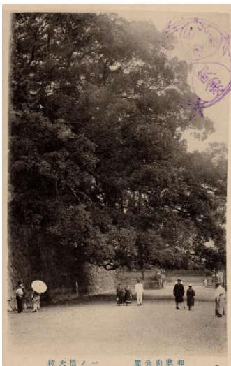
戦前期の 一の橋 大手門 付近