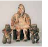
「葛城修験の世界」の展示