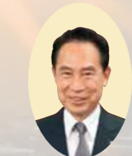
尾花 正啓 和歌山市長

結びに、市民の皆様方にとつて本年が幸多き、飛躍する年となりますようお祈り申し上げます、新年のご挨拶とさせていただきます。