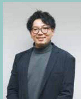
和歌山リハビリテーション専門職大学 基礎理学療法専門理学療法士