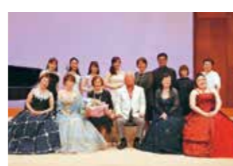
わかやましん 和歌山市民オペラ協会

さらに、平成27年から現在まで「和歌山城で学ぶお城教室」の講師として、和歌山城に残る往時の職人たちの技術や歴史を伝えるために、参加者と一緒に城内を巡る取組みを続けている。和歌山城の魅力について、愛好家はもとより初心者にも広くわかりやすく伝えるなど、本市の文化振興に大きく貢献している。