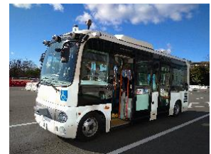
車両所有者：国立大学法人群馬大学

※2月14日（水）の1便出発前に「出発式」を予定しています。詳細については後日改めてお知らせします。