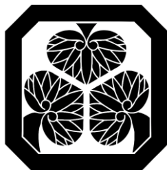
西条松平家の家紋 “隅切三つ葵紋” (西条三つ葵紋)

本展では、西条松平家初代である松平頼純と西条藩主から紀州藩主を引き継いだこの2名(宗直・治貞)を中心に、紀州藩主となっていたかもしれない人物たちも含めて紹介いたします。