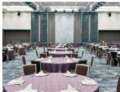
Daiwa Roynet Hotel Wakayama