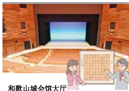
和歌山城会馆大厅

我们将公布两位棋手所提供的「胜负餐」「胜负点心」「胜负饮料」的候选菜单。此外,我们会根据棋手选定的菜单制作成小册子,向全国广泛宣传和歌山市的美食。详情请浏览市HP (ID:1058413) 确认