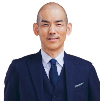
シンガー 木山 裕策 氏