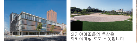
와카야마조홀의 옥상은 와카야마성 포토 스폿입니다!

2021년 10월에 개관한 와카야마조홀. 시민이 창조, 발신해가는 문화거점이며 와카야마시의 예술문화의 심볼로서, 시내, 외 해외와의 교류를 도모할기차게 발신하고 있습니다.