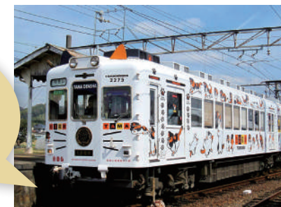
다마 (고양이) 전철 Designed by Eiji Mitooka+Don Design Associates

램핑 전철이나 온천 등, 와카야마시에는 즐겁고, 귀엽고, 재미있는 것들이 많이 있습니다.