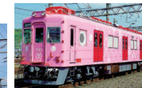
메데타이 (도미) 전철