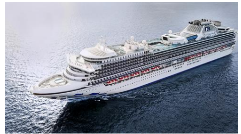
<ダイヤモンド・プリンセス>

(船名) ダイヤモンド・プリンセス 総トン数：115,906トン 全長：290m 乗客定員：2,706人 乗組員数：1,100人