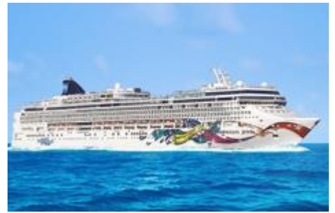
「NORWEGIAN CRUISE LINE」HPより

(船名) ノルウェー ジャン・ジュエルについて 総トン数：93,502 トン 全長：294.13m 乗客定員：2,866 人 乗組員数：1,069 人