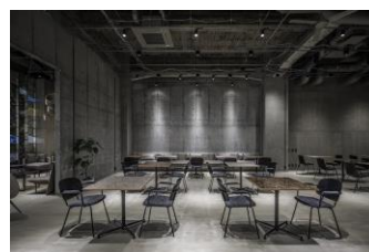
(Park Biz WAKAYAMA)