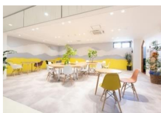
(サテライトオフィス kinowa)

本市が実施したサテライトオフィス等開設支援補助金を活用して整備された5施設が令和5年度までにすべて完成し、市内外から22社が入居されています。今後も立地を検討する企業にサテライトオフィス等を案内し、本市への立地を推進していきます。