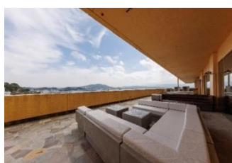
(MANPA RESORT OFFICE)