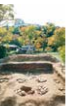
企画展「和歌山城を掘る」イメージ