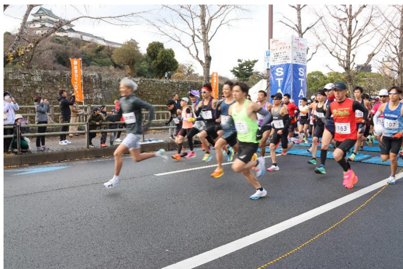
<第21回 ハーフスタート>