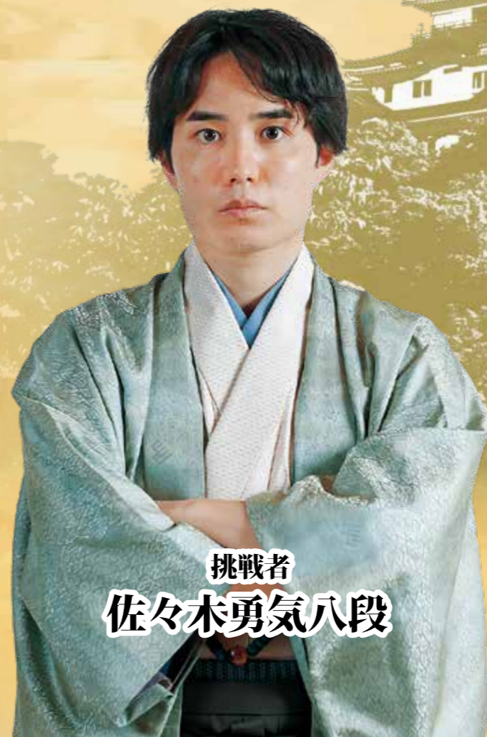
挑戦者 佐々木勇気八段

◎主催/読売新聞社、日本将棋連盟 ◎問合せ/文化振興課 ☎435-1194、広報広聴課 ☎435-1009