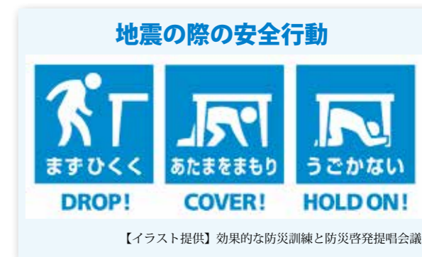
【イラスト提供】効果的な防災訓練と防災啓発提唱会議