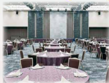
ダイワロイネットホテル和歌山

⚠ 第5局までに、藤井聡太竜王か佐々木勇気八段が4勝した場合、和歌山対局はありませんが、11月26日(火)に竜王を迎え祝賀会を開催します。