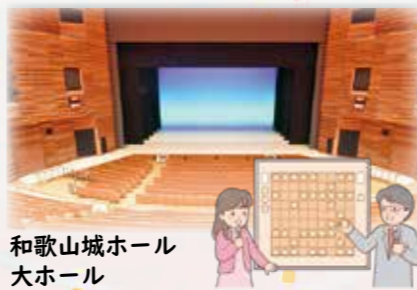
和歌山城ホール 大ホール

両棋士に提供する「勝負めし」「勝負おやつ」「勝負ドリンク」の候補を発表します。 また、選定した品によりメニューブックを作成し、広く周知を行うことで和歌山市の食の魅力を全国に発信していきます。詳細は、市HP(ID:1058413)でご確認ください。