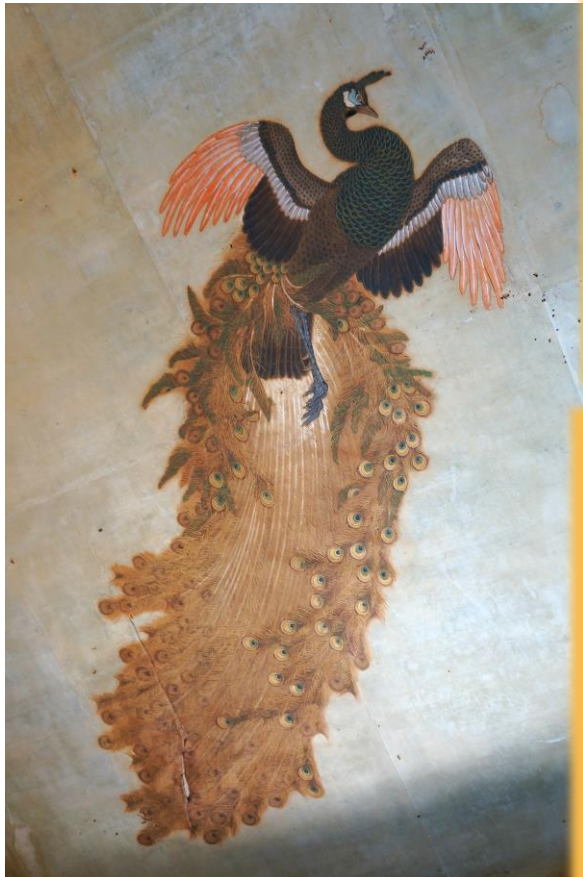
[写真] 湊御殿「孔雀図」／感應寺 ※通常非公開

本展では、これら“御殿”の中から、江戸初期に設けられて「下屋敷」と呼ばれた藩主の別邸である湊御殿、城下町北西側の紀の川右岸にあった北島御殿（以上、第1会場（和歌山城天守閣）にて展示）、江戸後期の藩主である徳川治宝が自身の別邸・隠居屋敷とした西濱御殿と養翠園（以上、第2会場（わかやま歴史館2階歴史展示室）にて展示）について、各御殿に関する解説と貴重な資料をご覧ください。