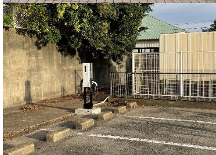
①和歌山市民体育館