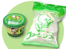
グリーンソフト (抹茶ソフト)