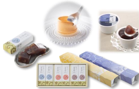
駿河屋のミニ羊羹、プリン、水羊羹