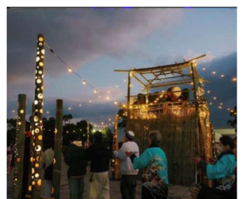
“竹あかり”を使った櫓