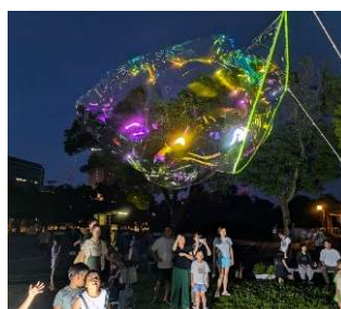
プリズムナイトバブル