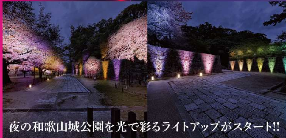
夜の和歌山城公園を光で彩るライトアップがスタート!!

※ ショーの前後は天守閣周辺、砂の丸広場及び付近で立入規制を行います。 ※ 当日の天候によりショーは中止となる場合があります。 ※ 悪天延期の場合の振替日は11月26日(火)となります。