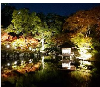
西之丸庭園ライトアップ