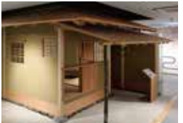
茶室 实际庵的原寸大模型