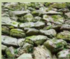
结晶片岩的野面垒砌法

从1585年建城时的石垣开始,每次修建时用的石材都会是随着城主而变。在和歌山城里“结晶片岩的野面垒砌”的天守台石垣应该是最古老的石垣。试着去探索一下随时代变迁的石垣墙也很有意思。