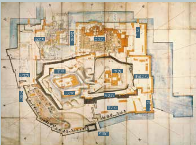
和歌山城内建筑平面图 (和歌山县立图书馆珍藏) 约在1800年所制的平面图。可以在此探索一下幕末时期的和歌山城面貌。每次新建或改建时都会绘制新图剪贴在原图上、是掌握城内建筑物的一份基础资料。