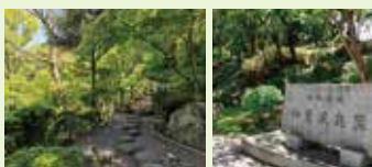
青翠新绿时期也相当美丽