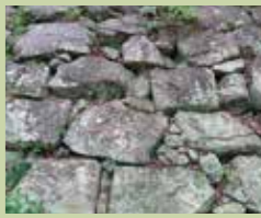
砂岩的充填式垒砌法