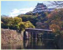
御桥廊下和天守阁

开放时间:上午9:00-下午5:00 (下午4:45停止入场) 休息日:12月29日-12月31日 门票:免费