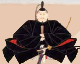
纪州德川家初代 德川赖宣