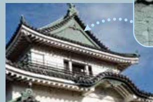
唐破风与青海波纹

大天守与小天守还有两个楼槽经多门槽连接的连立式天守与姬路城、松山城一起被称为日本三大连立式天守。1935年被指定为国宝后遭战火烧毁。战后,由于众多市民的要求,于1958年和歌山的標誌被重建落成。城堡的三层屋檐上都有唐破风还有千鸟破风等图案精心装饰、格调高雅、非常美丽。