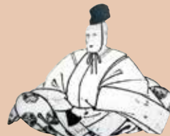
纪州德川家第十代 德川治宝

对于茶道·雅乐(宫廷传统音乐)·书画·陶艺等艺术和学问非常喜爱,被称为“敦寄藩主(文化之君主)”。还把和歌山城天守阁的黑墙改成了白墙,又亲自指挥重建由于落雷而被烧毁的天守阁,是与和歌山城有着很深感情的藩主。