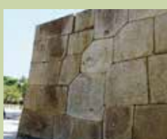
花岗岩加工垒砌法