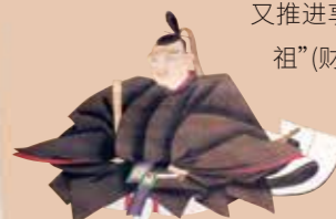
纪州德川家第五代 德川吉宗

2 德川吉宗(1684—1751) 提倡开垦与俭约,重建了当时持续的纪州藩的赤字财政。1716年,他的治理手法得到很高的评价,上任了江户幕府第八代将军。之后又推进享保的改革,被称为江户幕府“中兴之祖”(财政改革的优秀统领)