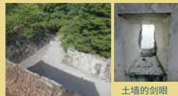
枡形虎口 土墙的剑眼