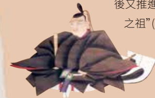
紀州德川家第五代 德川吉宗

2 德川吉宗(1684-1751) 提倡開墾與儉約、重建了當時持續的紀州藩的赤字財政。1716年、他的治理手法得到很高的評價、上任了江戶幕府第八代將軍。之後又推進享保的改革、被稱為江戶幕府“中興之祖”(財政改革的優秀統領)