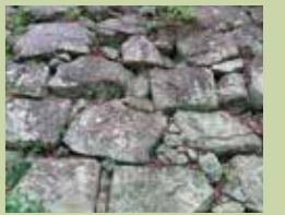
砂岩的充填式壘砌法