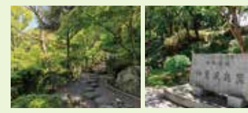
青翠新綠時期也相當美麗