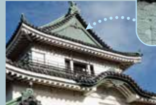
唐破風與青海波紋

大天守與小天守還有兩個樓檣經多門櫓連接的連立式天守與姬路城、松山城一起被稱為日本三大連立式天守。1935年被指定國寶後遭戰火燒毀。戰後、由於眾多市民的要求、於1958年和歌山的標誌又被重建落成。城堡的三層屋檣上都有唐破風與千鳥破風等圖案精心裝飾、格調高雅、非常美麗。