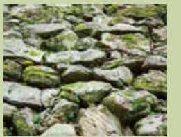
結晶片岩的野面壘砌法

從1585年建城的石垣開始、每次修建時用的石材都會隨著城主而變。在和歌山城里“結晶片岩的野面壘砌”的天守台石垣應該是最古老的石垣牆。試著去探索一下隨時代變遷的石垣牆也很有趣。