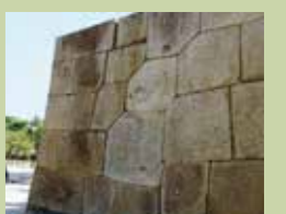
花崗斑岩加工壘砌法