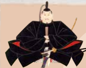
紀州德川家初代 德川賴宣