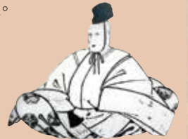
紀州德川家第十代 德川治寶

3 德川治寶(1771~1852) 對於茶道・雅樂(宮廷傳統音樂)・書畫・陶藝等藝術和學問都非常喜愛、被稱為“數寄藩主”(文化之君主)。還把和歌山城天守閣的黑牆改成了白牆、又親自指揮重建由於落雷而被燒毀的天守閣、是與和歌山城有很深感情的藩主。