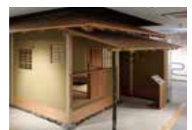
茶室 實際庵的原寸大模型

電影廳“和歌山城復原”動畫片 根據近世紀後期的和歌山城內郭的學術考證資訊製作了VR(虛擬實景)影片、大屏幕上映和歌山城曾經的壯麗姿態。(上映時間約12分鐘)