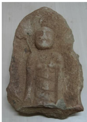
石垣から見つかった 石仏(地蔵菩薩立像)

令和7年(2025年)は、和歌山城が創建されて440年となります。これまで、岡口門(国重要文化財)などの数少ない江戸時代の遺構について取り上げる展示を開催してきましたが、今回は戦国時代末期の創建以来440年の歴史を伝える城の石垣に着目します!