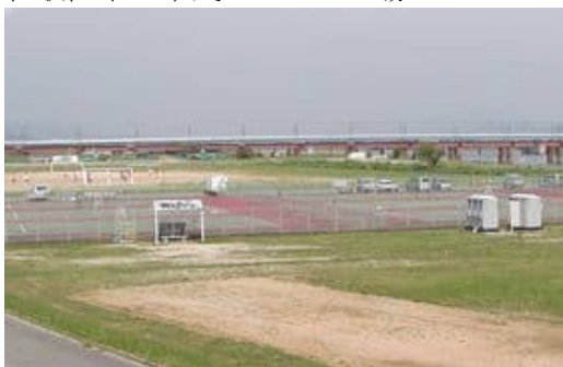
和歌山市立市民スポーツ広場