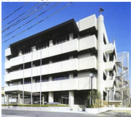
和歌山市ふれ愛センター

障害者支援課所管の指定管理者制度導入施設は、和歌山市ふれ愛センターである。この施設は、市民の地域活動の振興及び社会福祉事業の総合的な推進を図り、もって市民の福祉の増進に寄与することを目的として設立され、平成 18 年度から指定管理者制度が採用されている。令和 6 年度までは、非公募により市の外郭団体である社会福祉法人和歌山市社会福祉協議会を選定し管理運営を行ってきたが、同施設は、高齢者のみでなく障害者の活動や交流の場として利用されており、より専門的な事業者のノウハウを活用した運営とするため、令和 7 年度からは公募による選定へ移行している点に特色がある。なお、福祉増進という設置目的や、主に利用する団体が障害者団体や高齢者団体であるため、利用料金制は採用していない。