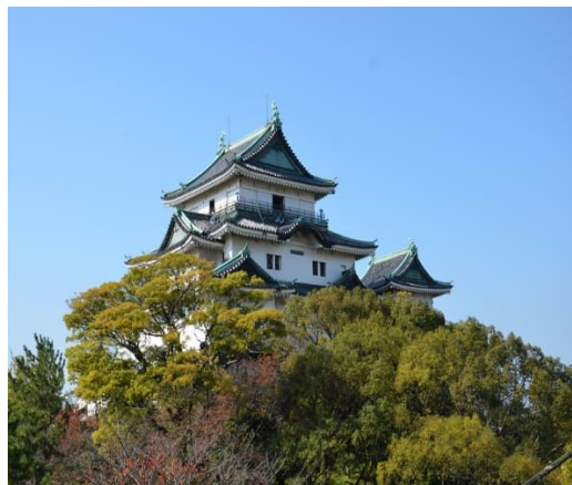
和歌山城公園駐車場