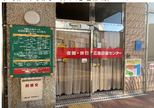
和歌山市夜間・休日応急診療センター

総務企画課所管の指定管理者制度導入施設は和歌山市夜間・休日応急診療センターである。当施設は、市民の急病に迅速かつ適切な応急診療を提供するために設置された医療施設である。主に夜間及び休日の通常の医療機関が休診となる時間帯に、内科・小児科・耳鼻咽喉科・歯科の初期診療を実施しており、平成 18 年より指定管理者制度を導入している。新型コロナウイルス感染症の患者増加により令和 4、5 年度に多くの利益を計上し、余剰資金が発生したことから、令和 4、5、6 年度においては指定管理料となる交付金が支出されていないことに特徴がある。