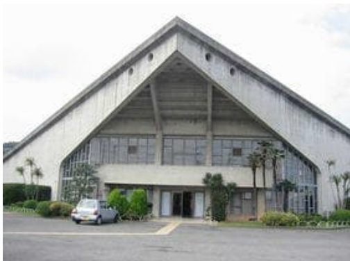
和歌山市立松下体育館