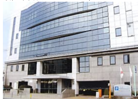
和歌山市河西コミュニティセンター