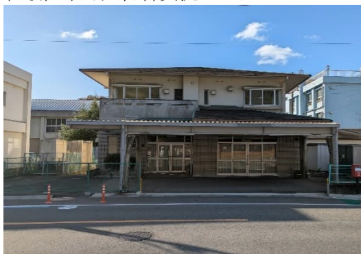
和歌山市加太総合交流センター

その利用が各施設の所在する地域の自治会又は連合自治会に限られることから、非公 募により同団体を選定している。