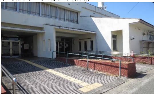
和歌山市立芦原共同浴場

保険総務課所管の指定管理者制度導入施設は和歌山市立芦原共同浴場と和歌山市立杭の瀬共同浴場である。これらの施設は地域改善を目的として設立され、平成 18 年度から指定管理者制度が採用されており、非公募で地域の運営委員会を指定管理者に選定している。両施設ともに利用料金制を採用しており、利用料金で賄えない運営費用については指定管理料により運営している。