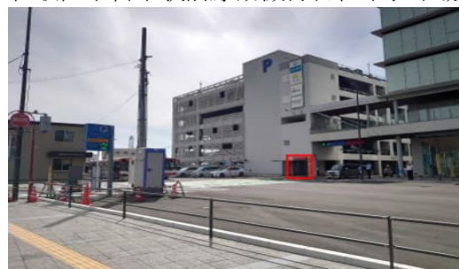
和歌山市営市駅前原動機付自転車駐車場