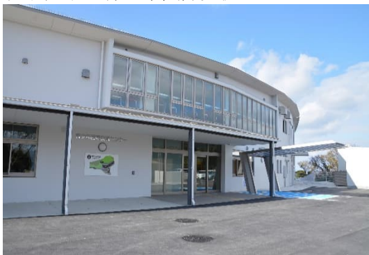
和歌山市立青少年国際交流センター

青少年課所管の指定管理者制度導入施設は和歌山市立青少年国際交流センターである。当施設は平成 30 年にこれまで長年親しまれてきた「少年自然の家」をリニューアルし、和歌山市立青少年国際交流センターとして新しくオープンし、指定管理者制度を採用している。当施設の利用団体は従来からの小中学生の利用に加え、幅広い年代の方や外国から来られた方も利用でき、国際交流活動やスポーツ合宿、文化・芸術活動などを行うすべての世代の団体が利用でき、海外からの利用者もいることに特徴がある。