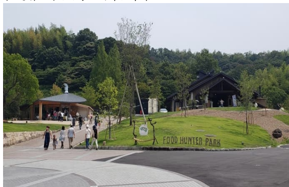
和歌山市四季の郷公園

平成21～令和3年度まで、地元の農業者を中心に組織され、従業員も地元の人を雇用しており、地域農業に精通するとともに地元の農業者との連携を持っていた有限会社四季の郷を非公募として選定していたが、指定管理者の切り替えのタイミングの令和4年4月から公募により有限責任事業組合FOOD HUNTER PARKが選定されている。また、自立可能な公園運営を目指すため利用料金制を採用している。