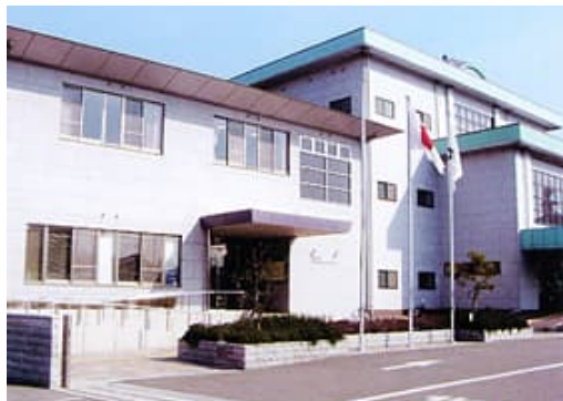
和歌山市中央コミュニティセンター