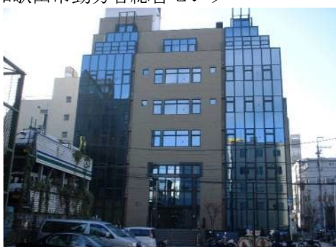
和歌山市勤労者総合センター