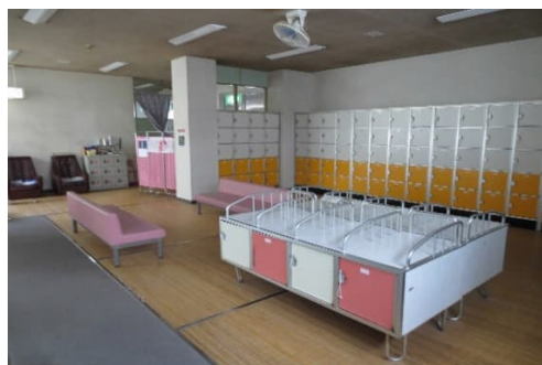
和歌山市立杭の瀬共同浴場