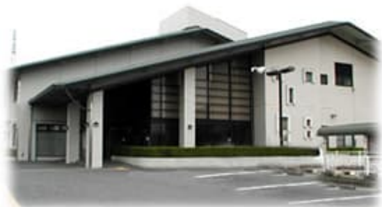
和歌山市東部コミュニティセンター