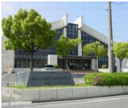
和歌山市立河南総合体育館