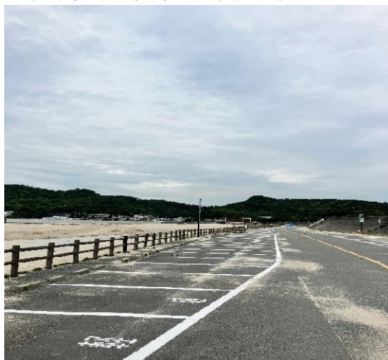
和歌山市営片男波海水浴場駐車場

また、県と市が共同で運用している関係から、市のみが利用料金制を導入することは困難なため利用料金制を採用していない。