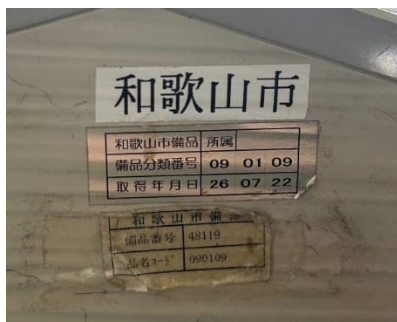
和歌山市営六十谷駅前自転車等駐車場事務所内のレジスター

しかし、現地照合調査の結果、管理シールの貼付が徹底されていない事例や、出納室から配布された管理シールの所在が施設内で不明となっている事例が多く確認されている。管理シールの貼付が徹底されていないことで、同じ種類の備品が複数存在する場合に、それぞれの備品番号や取得時期を現物と正確に紐づけることができず、現物照合や台帳管理が困難になる。これにより、資産の識別性や管理の実効性が著しく低下し、紛失や誤用のリスクが高まる。