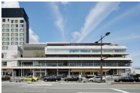
和歌山市民図書館

読書活動推進課所管の指定管理者制度導入施設は、和歌山市民図書館及び和歌山市民図書館西分館である。和歌山市民図書館及び西分館は、市民の教育と文化の発展に寄与することを目的として設置され、和歌山市民図書館を和歌山市駅前に移転し、運営していくに際して、指定管理者制度を導入している。