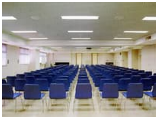
和歌山市西庄ふれあいの郷