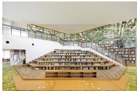
和歌山市民図書館西分館