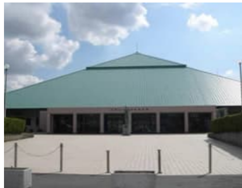
和歌山市立市民体育館