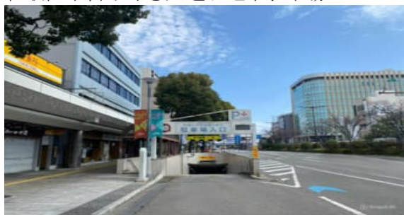
和歌山市営けやき大通り地下駐車場