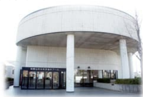
和歌山市立市民温水プール